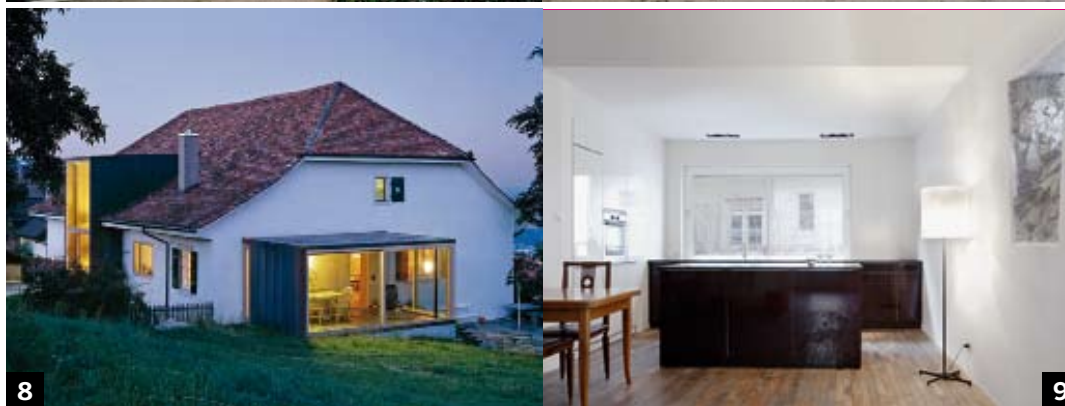
8 Kistler Vogt Architekten, Biel Dipl. Architekten ETH BSA SIA www.kistler-vogt.ch Umbau Tenn, Magglingen