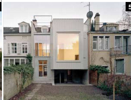
5 Christ & Gantenbein, Basel Dipl. Architekten ETH SIA BSA www.christgantenbein.com Anbau und Renovation Altstadtthaus, Basel