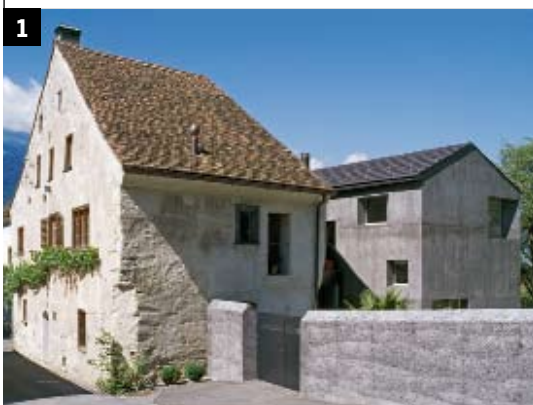
1 atelier-f architekten K. Hauenstein, Fläsch Dipl. Architekt ETH SIA www.atelier-f.ch Renovation und Anbau Weinbauernhaus, Fläsch