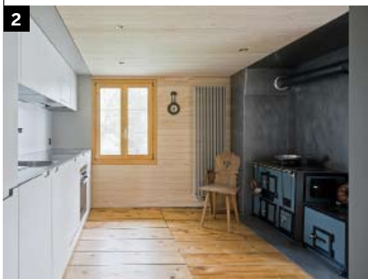
2 BGS Architekten, Rapperswil www.bgs-architekten.ch Umbau Haus am See, Rapperswil-Jona