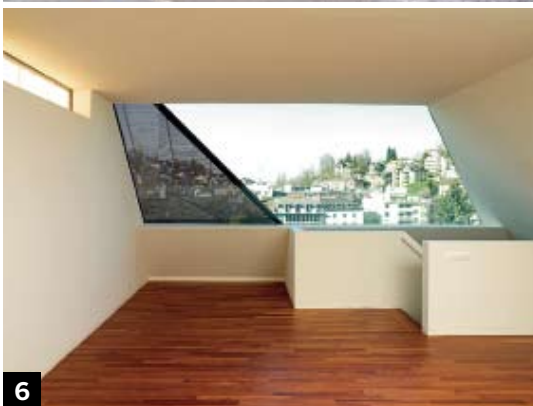
6 Daniele Marques AG, Luzern Dipl. Arch. ETH SIA BSA www.marques.ch Aufbau Dachgeschoss, Luzern