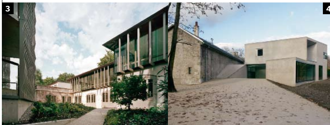
4 Charles Pictet, Genf Architecte FAS SIA www.pictet-architecte.ch Erweiterung eines Gewächshauses, Cologny