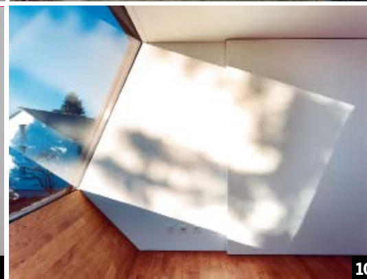
10 studer strasser architekten, Basel Architekten SIA www.studerstrasser.ch Ausbau Dachraum, Basel

Die Redaktion der Zeitschrift «Umbauen+Renovieren» wählte aus 81 Einsendungen die zehn besten Umbauten der Schweiz und Liechtensteins aus. Die Auswahl fiel nicht leicht, denn die Bandbreite der eingereichten Projekte war enorm. Vom umgebauten Lagerhaus über das sanierte Altstadtthaus bis hin zur Renovation und Erweiterung eines Gewächshauses aus dem Jahr 1808 war alles vorhanden. Die